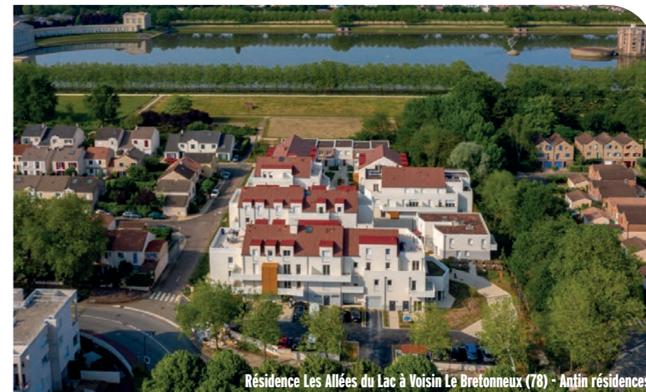
Résidence Les Allées du Lac à Voisin Le Bretonneux (78) - Antin résidences