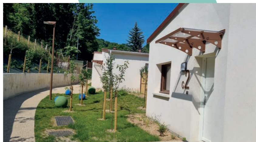
Résidence Simone Veil à Amfreville-la-Mivoie (76) – LE FOYER STEPHANAIS

Le label Mon Logement Santé vise à garantir aux habitants, pour tous les moments de la vie, un habitat qui agisse de manière positive sur leur santé. Il se réalise de manière opérationnelle à travers 3 thématiques d'engagements :