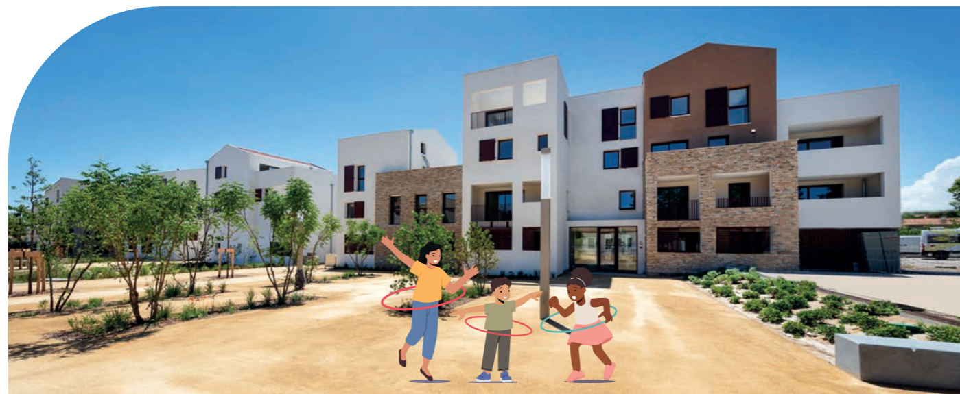
Résidence Cœur d'Oc à Saint Georges d'Orques (34) – SFHE

Demain, un référentiel d'engagement Mon Logement Santé s'appliquera aussi pour la réhabilitation du parc existant.